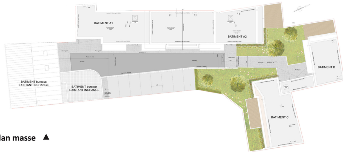
plan masse ▲